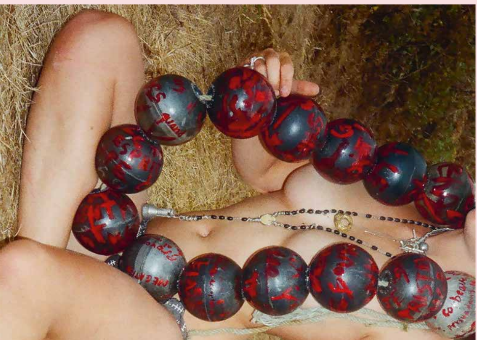
► COLOMBE D'HUMIÈRES, SAUVENGE AUTOMATIQUE, 2018, HAAR SIERAAD, BOEIEN, VIERE, ZILVER, 1000 X 500 X 140 MM