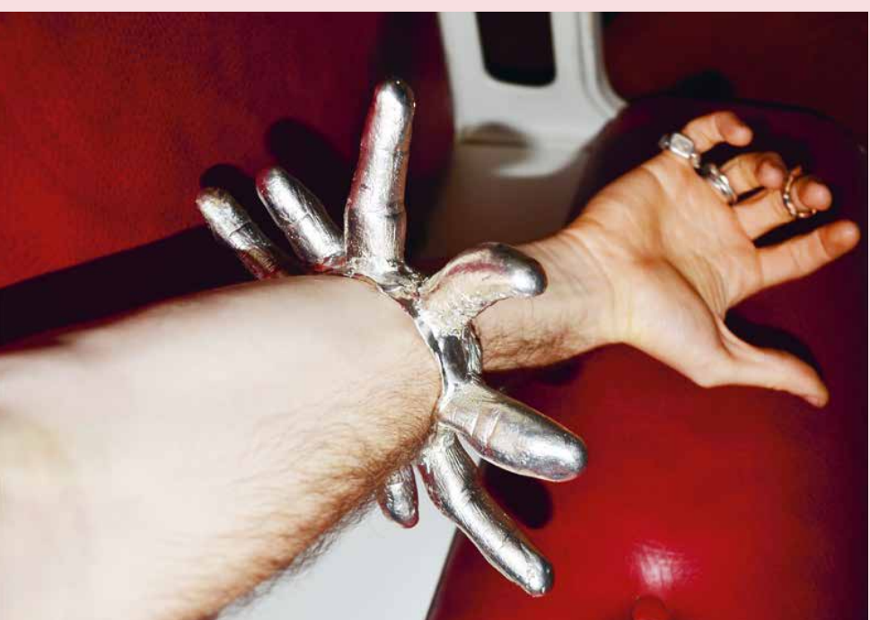
► COLOMBE D'HUMIÈRES, DROITS D'HONNEUR (DIGNITY INWARDS), 2018, ARMBAND, WAX, ELECTROFORMED ZILVER, 200 X 200 X 20 MM, PARTICULIERE COLLECTIE

Is van 29 april t/m 3 mei te zien op de KunstRaI (Amsterdam) in de stand van Galerie Door. www.colombedhumieres.com